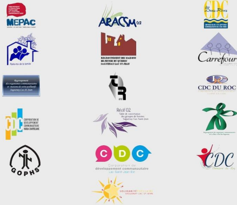
Table Des Regroupements du Saguenay-Lac-Saint-Jean

La Table des Regroupements du Saguenay-Lac-Saint-Jean comprends 15 regroupements locaux ou régionaux. Ceux-ci représentent les groupes communautaires de la région du Saguenay-Lac-Saint-Jean, soit près de 300 organismes.